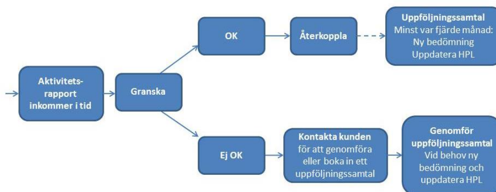
Figur 4.1 Arbetsförmedlingens flödesschema över arbetsprocessen vid handläggningen av aktivitetsrapporter.

Figur 4.1 beskriver arbetsprocessen i ett flödesschema 15 :